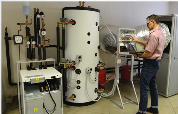
Untersuchung der Schichtung im Pufferspeicher