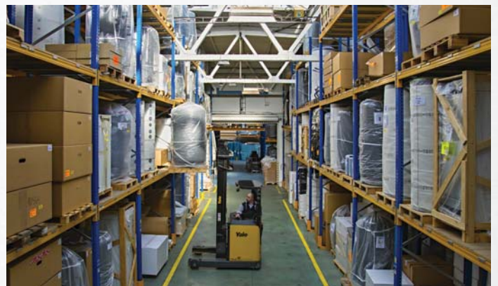
Zentrallager in Prag, CR

Durch unsere moderne Lagerverwaltung garantieren wir kurze Lieferfristen und eine schnelle Verfügbarkeit von Ersatzteilen.