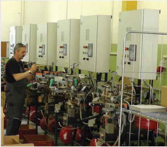
Herstellung in Reichenberg, CZ

In unseren Tochtergesellschaften in Tschechien und in der Slowakei stellen wir eine breite Palette an Pufferspeichern und Ausrüstung für die Steuerung und den Schutz von Kesseln her.