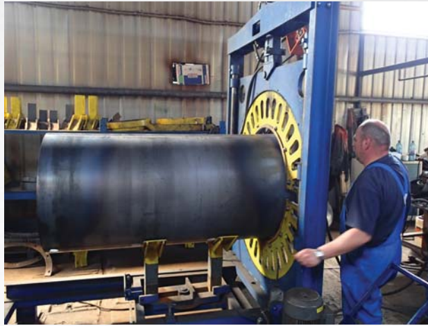
Herstellung in Presov, SK