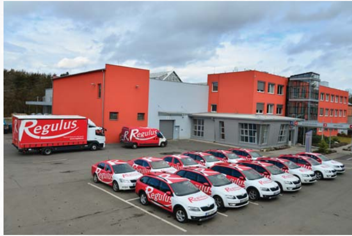
Firmenzentrale in Prag, Tschechische Republik